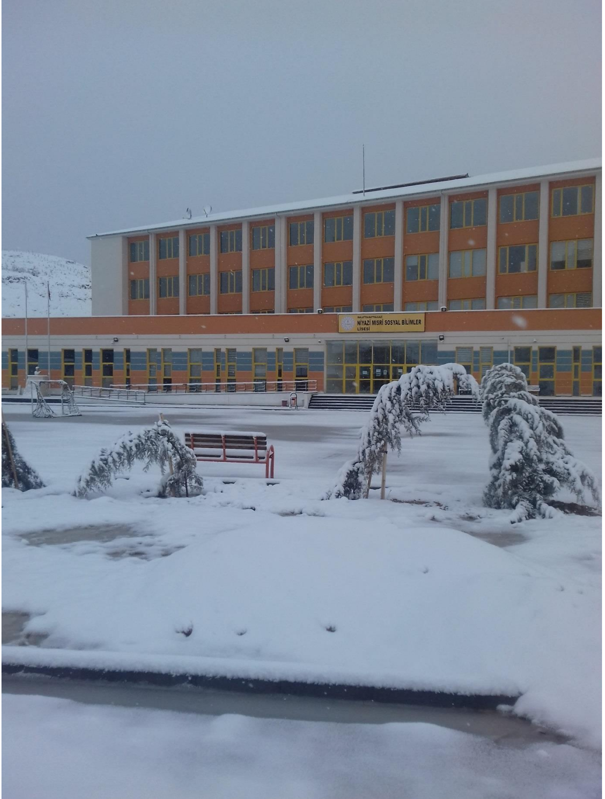
Fotoğraf 8) Doğa farkındalığı için öğrencilerimizin ilgiyle yaptığı çalışmalardan biri okulumuz bahçesinde ve yakın çevresinde görülen kar yağışları, sis olayları, bulut hareketleri gibi doğa olaylarının gözlenmesidir.