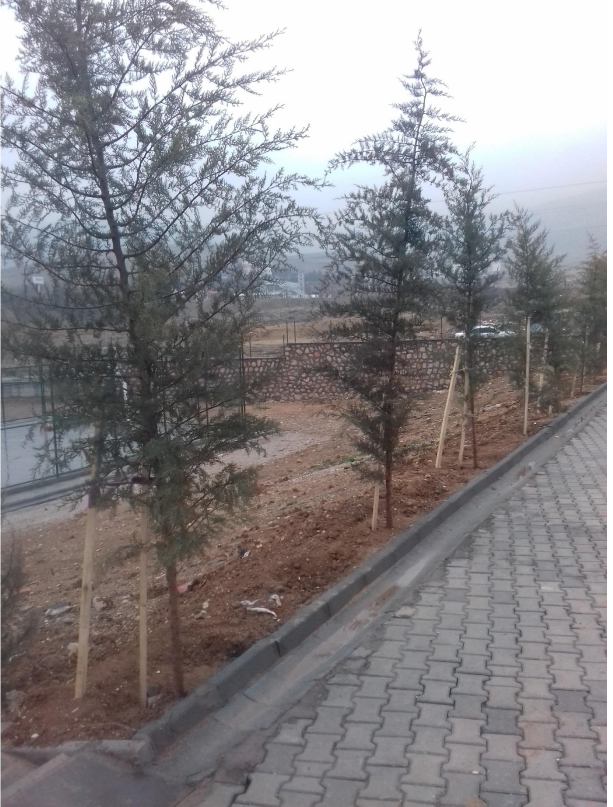
Fotoğraf 7) Okulumuzun bahçesinde Kasım 2019'dayapılan ağaçlandırma çalışmaları okul çevresinin şekillenmesinde etkili olmuştur. Fotoğrafta okulumuzun toprakla buluşan ilk fidanları görülmektedir.