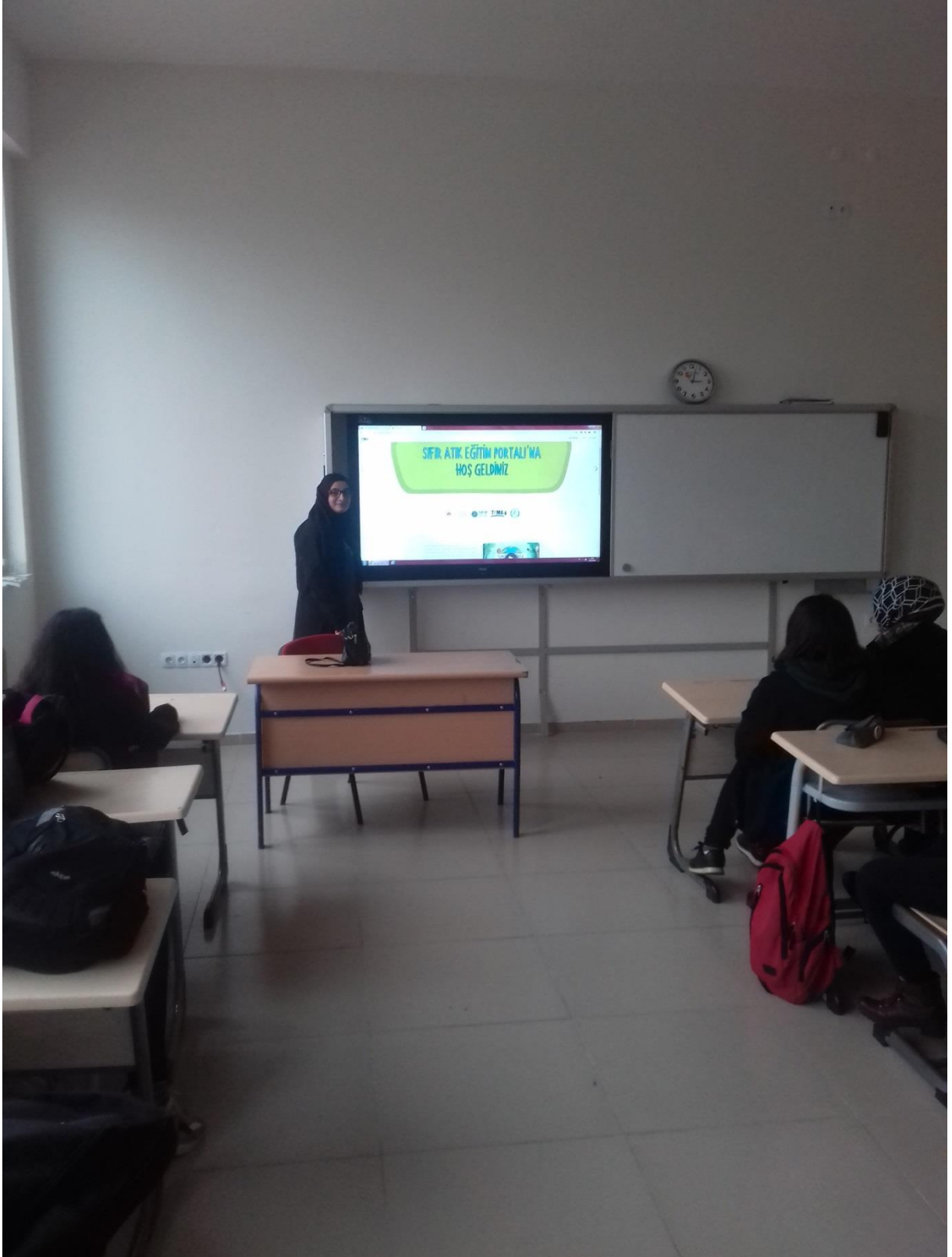
Fotoğraf 10) Hazırlanan sunumlar öğrencilerimiz tarafından kendi sınıflarında uygulandı.