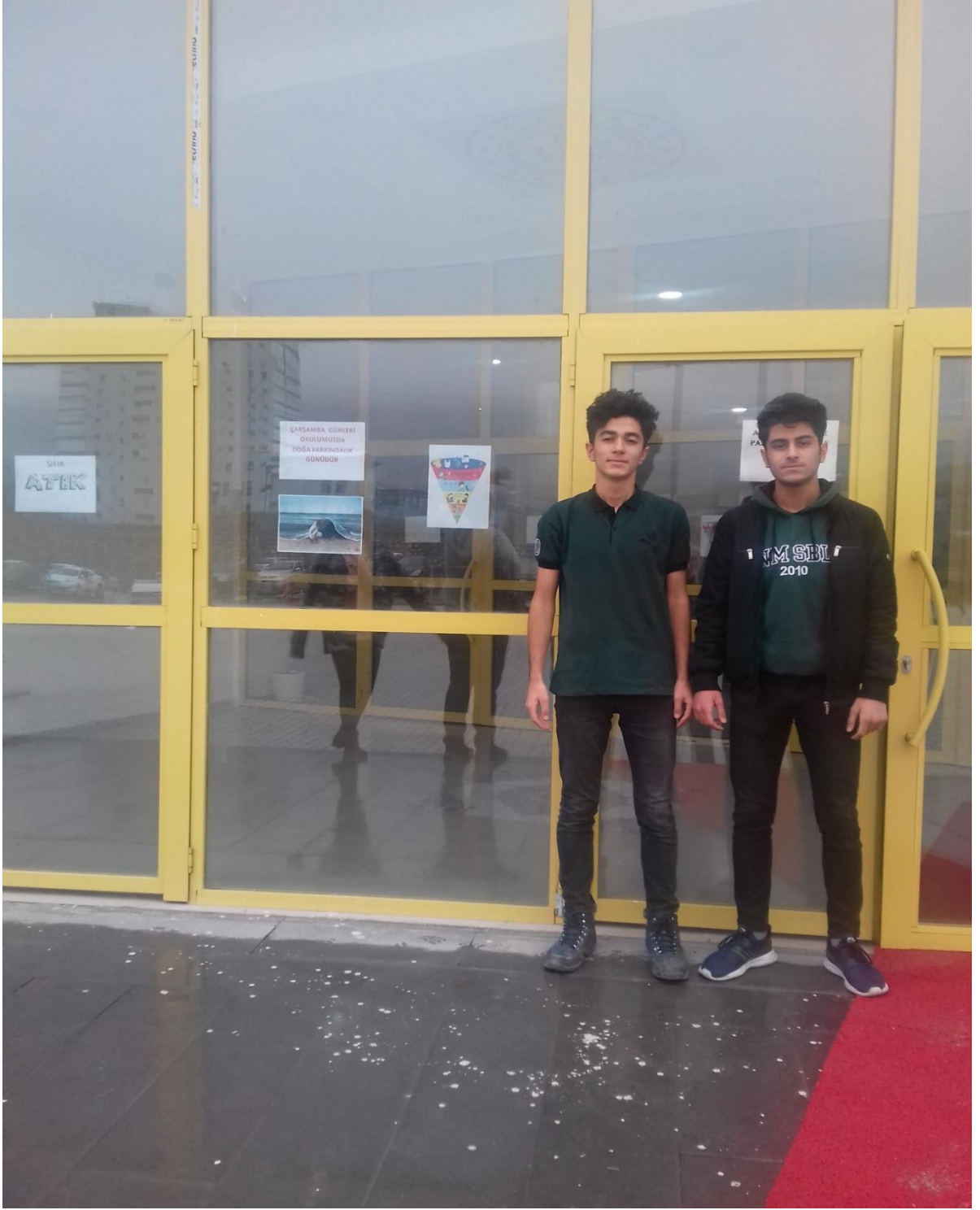
Fotoğraf 3) Okulumuzda İGS çalışmalarının önemli kısmı öğrencilerimiz tarafından yapılmaktadır.