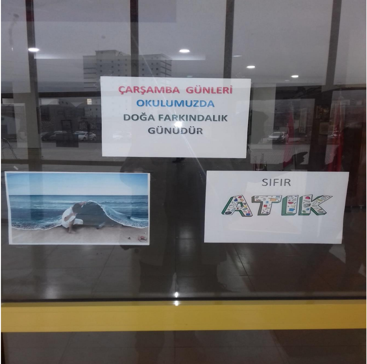
Fotoğraf 1) Çarşamba günleri okulumuzda doğa farkındalık günüdür.

Okulumuzda bu kapsamda Çarşamba günleri doğa farkındalık günü olarak ilan edildi. Çarşamba günleri yapılacak çeşitli etkinliklerle öğrencilerimizde çevre duyarlılığının ve değerler eğitiminde 10 temel değerden biri olan vatan sevgisinin gelişmesi amaçlanmıştır.