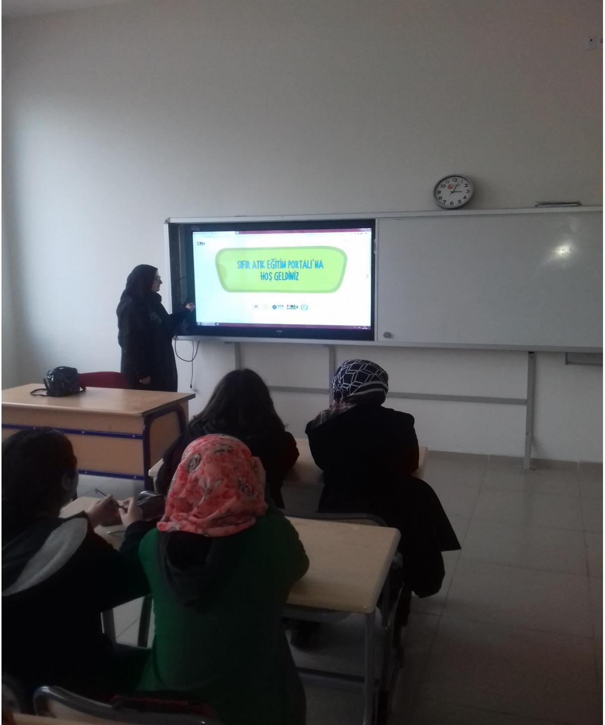
Fotoğraf 9) TEMA Eğitim Portalı içeriklerinde yararlanılarak sıfır atık projesiyle ilgili sunum çalışmaları yapıldı.

Ülkemizde uygulanmakta olan Sıfır Atık Projesine karşı okulumuzda duyarlılığın oluşması için pano çalışmaları ve sunumlar yapıldı. Bu çalışmalarda öğrencilerimiz aktif olarak görev aldılar.